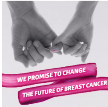
Utiliser la photo par défaut

Commencez par télécharger votre propre photo et ajoutez un ruban rose pour montrer votre soutien à la cause du cancer du sein. Assurez-vous de recharger une nouvelle photo pour passer d'une seule option de ruban à un double ruban.